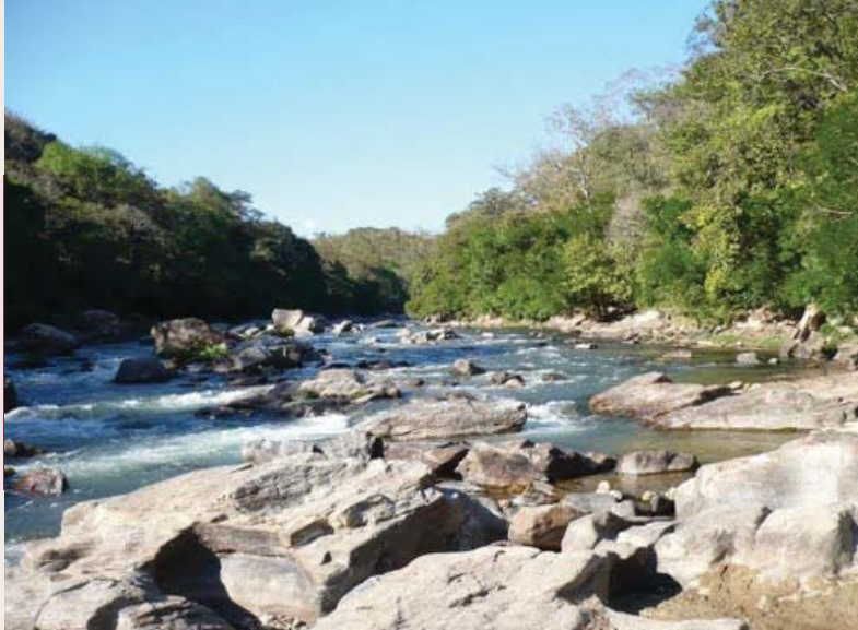
Río Xochistlahuaca, lugar donde viven actualmente los amuzgos.