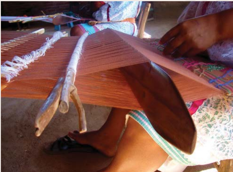
Mujeres hilando en Xochistlahuaca.

La organización de las fiestas, la compra de provisiones y la administración de los gastos para la misma queda a cargo de los mayordomos, cuya eficiencia los coloca en situación de privilegio para ocupar luego otros cargos.