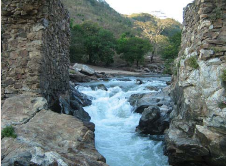
Xochistlahuaca, lugar donde viven actualmente los Amuzgos.