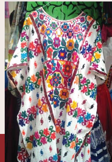
Huipil de San Pedro.