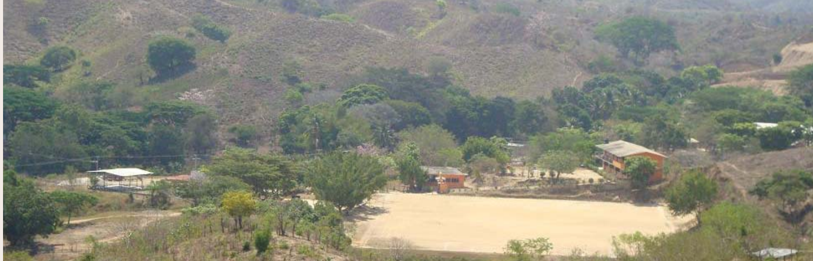
Lugar donde habitan actualmente.

La presencia de varios partidos políticos ha agudizado las diferencias entre los grupos que buscan ocupar los cargos políticos de las localidades. En ocasiones, son grupos con intereses externos a la comunidad los que disputan el control del poder municipal y agrario.