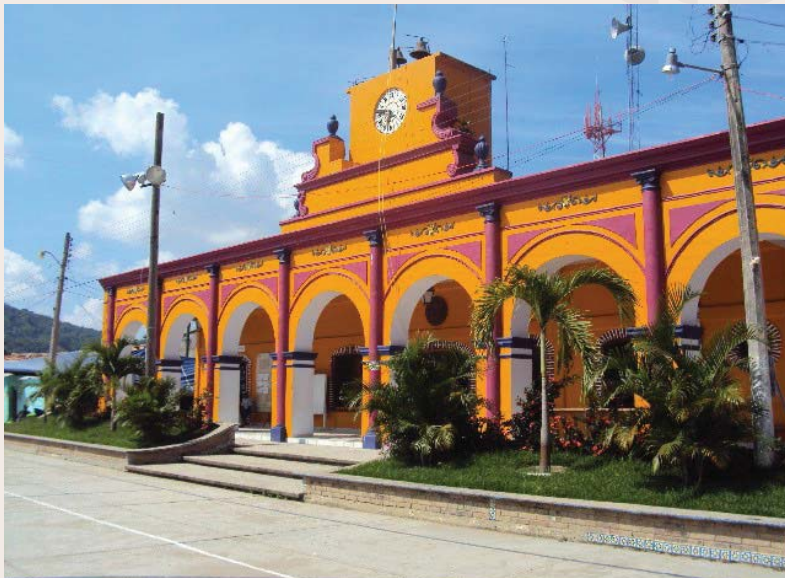
San Pedro Amuzgos.

totalidad de las lenguas otomangues es tonal y según datos del censo 2005 habría 49.000 hablantes que la practican en diversos dialectos. Un alto porcentaje del pueblo amuzgo es monolingüe, y en menor medida los hay bilingües sumando a la lengua materna el español.