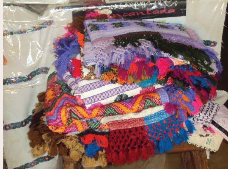
Local de venta.

solicitar su mano. La visita se repite hasta que finalmente es acompañado por el novio y los parientes más próximos que llevan como obsequios licor, alimentos y cigarros. Los hombres se casan en una edad promedio de 17 años y las mujeres de 15 y el casamiento es festejado con abundante comida, alcohol y música.