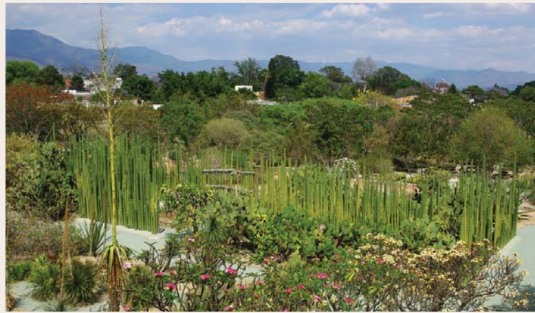
Jardín de cactus en Oaxaca, México.