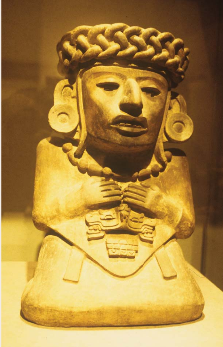
Museo cultural de Antropología de Culturas de Oaxaca.

sandía, naranja, lima, cuajinicuil, limón, mango, nanche, papaya, tamarindo, mandarina, coco, ciruela, café, cacao, zapote y mamey. Tienen también una ganadería reducida con vacunos, porcinos y aves de corral, que pastorean en las laderas.