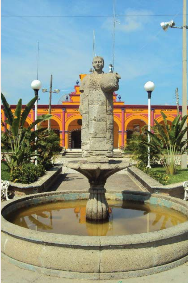
Estatua en Plaza Central.