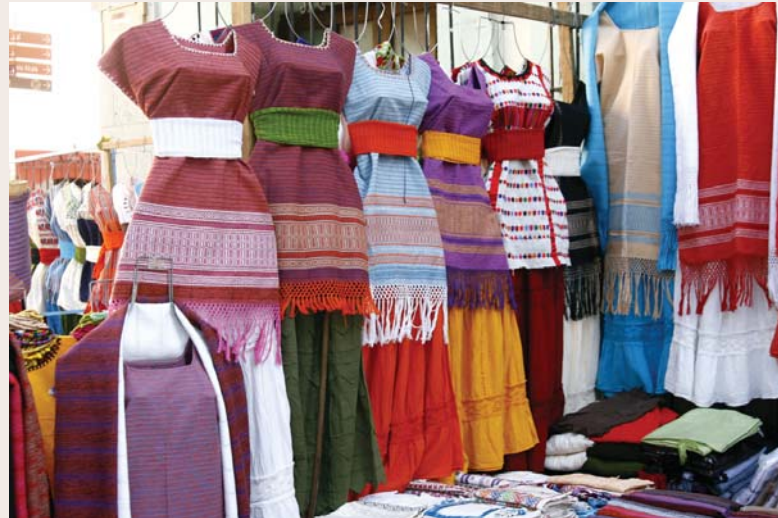
Tienda de ropa en Oaxaca, México.

Los amuzgos practican la agricultura que gracias a las condiciones climatológicas les permite sembrar maíz, frijol, chile, ajonjolí, cacahuate, calabaza y caña; así como la producción del plátano, aguacate, melón,