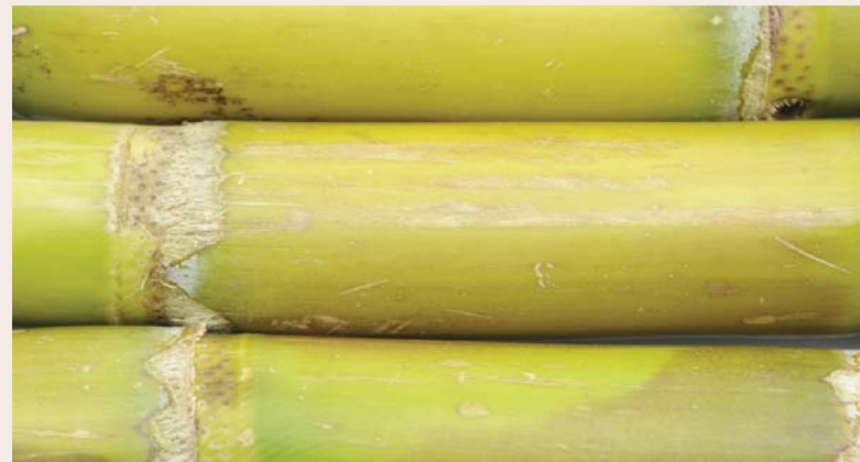
Caña de azúcar.

Las condiciones variables del clima y las altitudes son las que generan una diversidad y una distribución de las asociaciones vegetales. En el área teenek predominan los bosques tropicales en alturas de los 50 a los 800 msnm, donde son elementos arbóreos característicos el ramón, palo mulato, ceiba, palo santo o multé chicozapote, copal, frijolillo, zocohuite, jobo, sabino y palo de rosa,