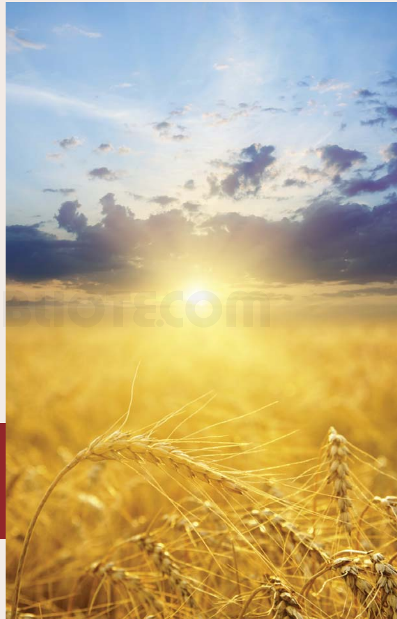
Cosecha de maíz.

Su vida religiosa se basa en el sincretismo de sus antiguas creencias prehispánicas y el catolicismo y trasciende los aspectos de la vida cotidiana.