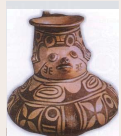
Cerámica de la Cultura Huasteca.