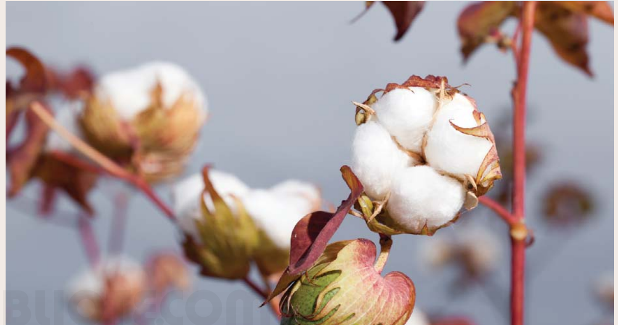
Cultivo de algodón.

Construían sus casas una al lado de la otra como en la cultura moderna. Para cuidar su privacidad, levantaban bardas de piedra y adobe