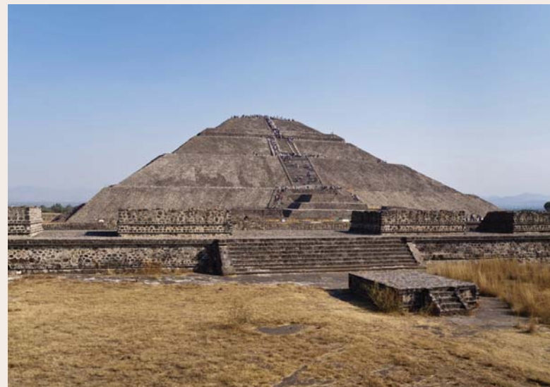
Pirámides de Teotihuacán, México.