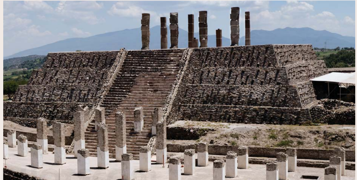
Ruinas toltecas en Tula, México.

separando las casas de la calle. Las puertas tenían forma de “ele”, y había que dar dos vueltas a la casa antes de entrar para evitar que un curioso se asomara al patio interior. En el patio, centro de la casa, colocaban un altar desde el que un Dios protegía a los habitantes. Los cuartos los construían alrededor del patio y eran ocupados por distintas familias relacionadas entre sí por parentesco.